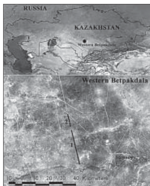
Рис. 1. Район работ

Из-за своеобразных ПЗУ на обследованных участках ЛЭП отмечен очень высокий