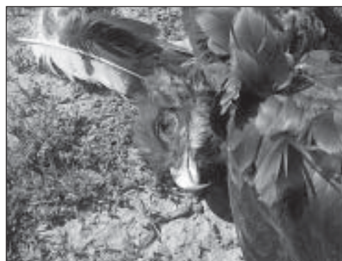
Змеяда ( Circaetus gallicus ), погибший от поражения электротоком.

Угловые опоры обследованной птицепасной ЛЭП и ближайшие к ней опоры безопасных для птиц ЛЭП привлекательны для устройства гнёзд хищными птицами, однако, несмотря на это, нами не обнаружено ни одного гнезда хищных птиц, как на этих ЛЭП, так и в радиусе 3 км от