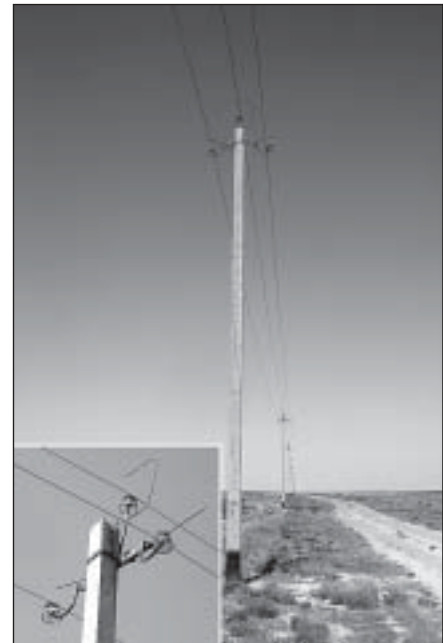
Рис. 3. Птицеопасная ЛЭП. Тип 2.

Fig. 3. The power lines dangerous for birds. Type 2.