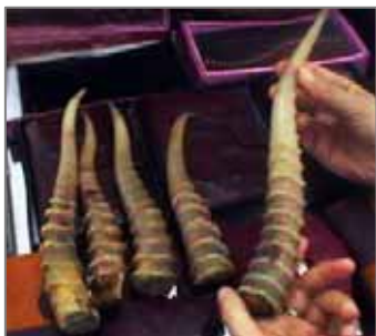
Рога самцов сайгака используются в Традиционной Китайской медицине.

В настоящее время FFI, подписавший Конвенцию по сохранению мигрирующих видов в качестве партнерской организации, планирует расширить работу по сохранению сайгака на Устюрте в Казахстане и Узбекистане. Международный Фонд Фауны и Флоры открыт для партнерских проектов, и для поддержки местных организаций и учреждений, вовлеченных в охрану сайгака и пустынных степей во всех четырех странах ареала сайгака. Для получения дополнительной информации обращайтесь к Ричарду Оллкору, FFI, ralicorn@fauna-flora.org